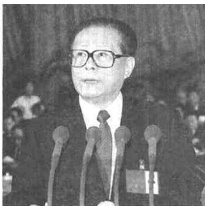
江泽民同志代表第十四届中央委员会向大会作报告

报告分十个部分：一、世纪之交的回顾和展望；二、过去五年的工作；三、邓小平理论的历史地位和指导意义；四、社会主义初级阶段的基本路线和纲领；五、经济体制改革和经济发展战略；六、政治体制改革和民主法制建设；七、有中国特色社会主义的文化建设；八、推进祖国和平统一；九、国际形势和对外政策；十、面向新世纪的中国共产党