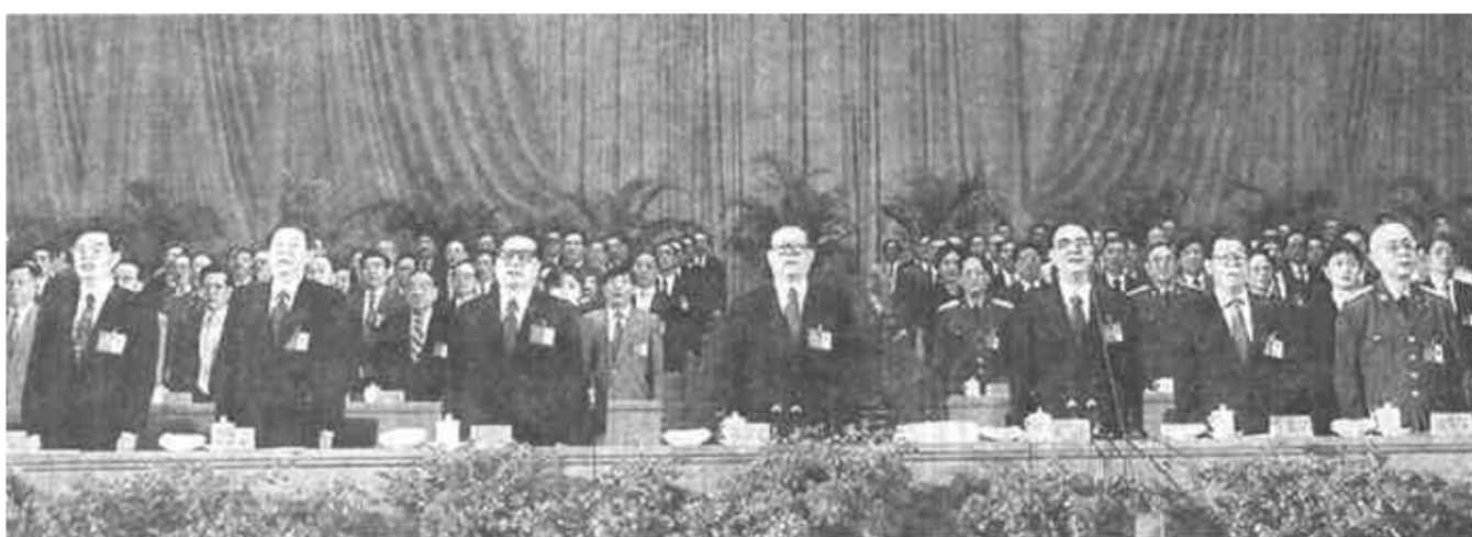
江泽民、李鹏、乔石、李瑞环、朱镕基、刘华清、胡锦涛等同志在主席台上。

9月12日上午，中国共产党第十五次全国代表大会开幕。图为大会会场。